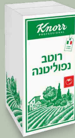
רוטב נפוליטנה "קנור"