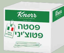
פסטה פטוצ'יני "קנור"