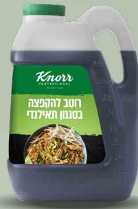
רוטב להקפצה בסגנון תאילנדי "קנור"