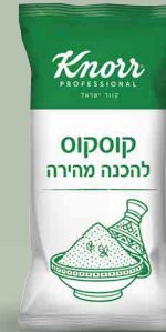
פתיתים אפויים "קנור"