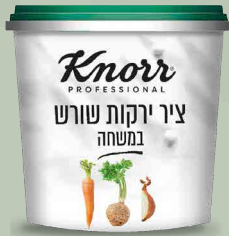
ציר ירקות שורש במשחה "קנור"