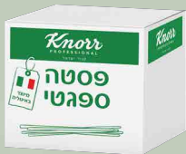
פסטה פטוצ'יני "קנור"