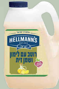
רוטב עם לימון שמן זית "הלמנס"